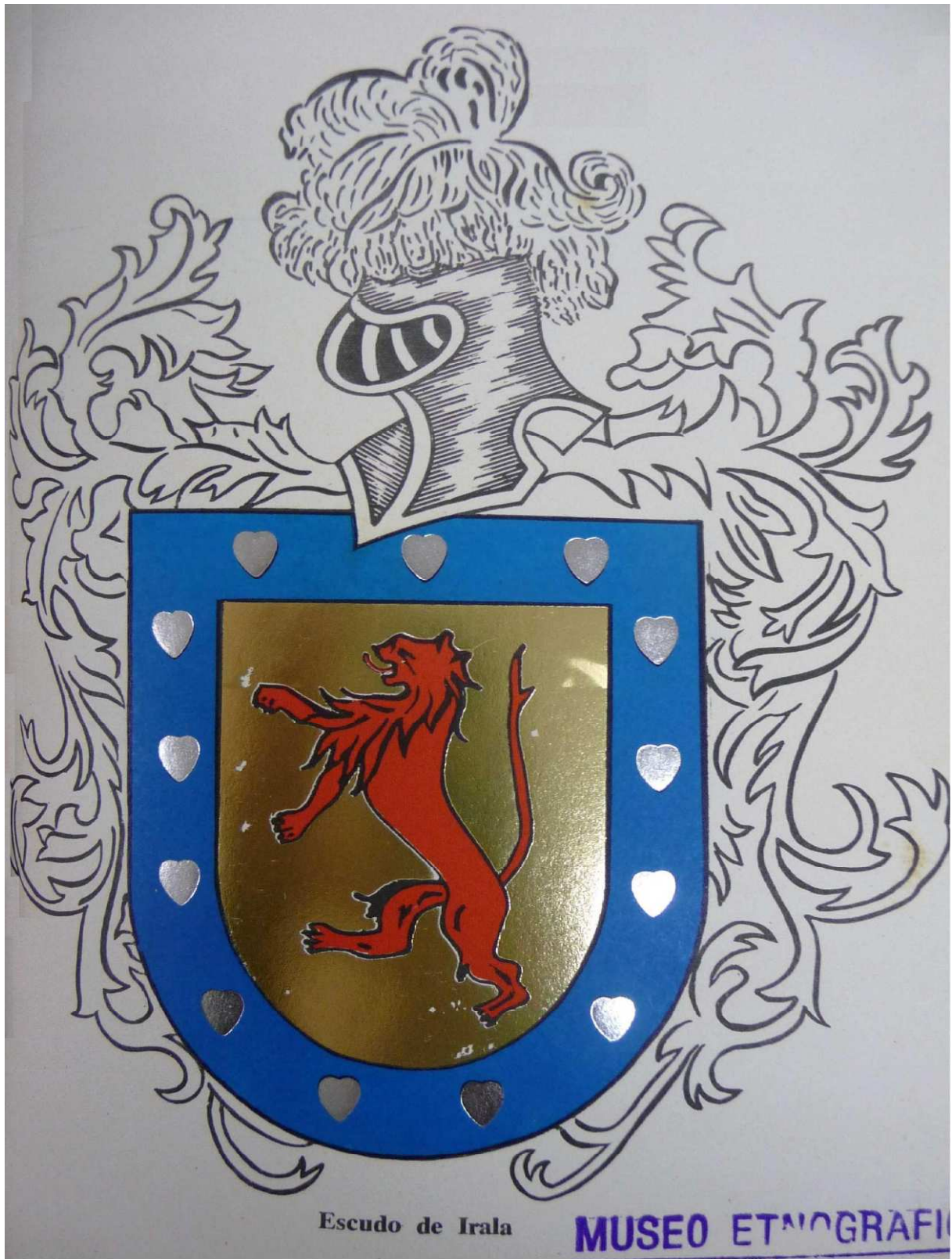
Blason de Domingo Martinez de Irala.