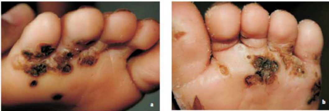
Figura 20. Infestación moderada en un niño. Pápulas agrupadas, negruzcas, costrosas (a). Hay numerosos huevos en las lesiones y adheridos a la piel vecina (b).

http://www.revistabiomedica.org/index.php/biomedica/article/view/185/366